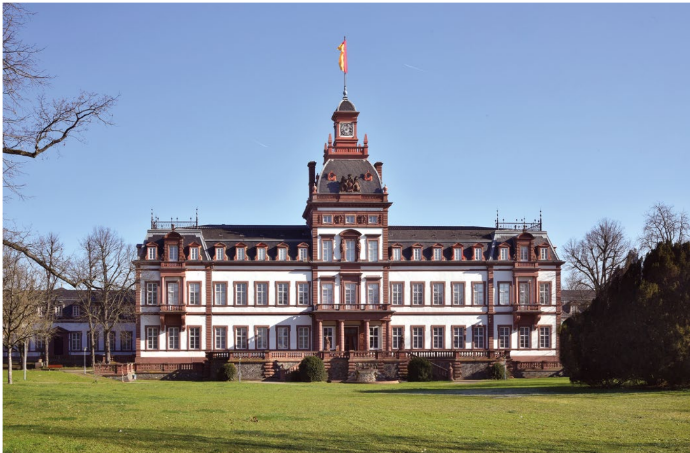
Abb.1: Schloss Philippsruhe, Gesamtansicht, 2023