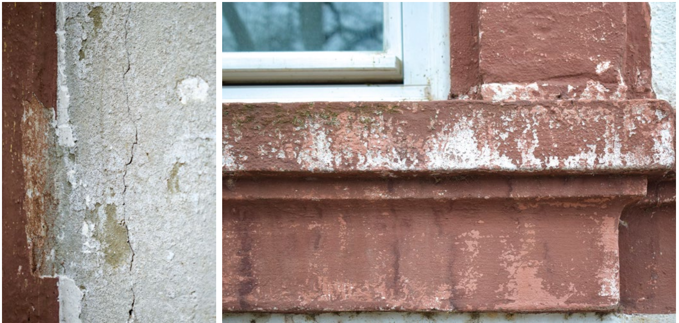
Abb. 2: Unter der historischen Farbfassung findet sich vielfach eine grünliche Fassung, die mit der klassizistischen Umgestaltung in Verbindung gebracht werden kann.